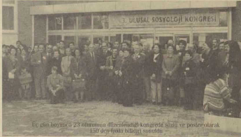
Üç gün boyunca 23 oturumun düzenlendiği kongrede sözlü ve poster olarak 150'den fazla bildiri sunuldu

Kongre Merkezi'nde üç gün süreyle üç ayrı salonda gerçekleştirilen kongrede sözlü ve poster olarak 150'den fazla bildiri sunuldu. Grup çalışmalarının da yapıldığı kongrede nüfus-sağlık, aile, kimlik, kültür, din, iletişim, çevre, sanayi,