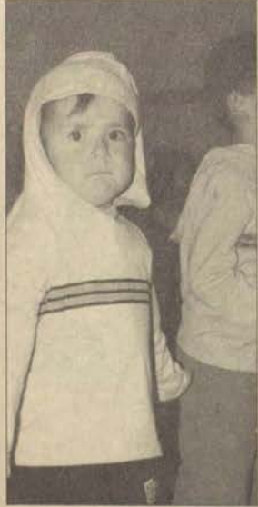
BESYO kurslarına çocuklardan büyük ilgi var

BESYO'nun açtığı basketbol ve aerobik-step kurslarına olan ilgi daha da artıyor