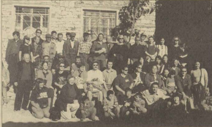
Günümüzde de seramikçilik, çiniçilik ve çömlekçilikle uğraşan Kınık, Sorkun köylerine ve Kütahya iline yapılan gezilerle edinilen bilgiler pekiştirildi.