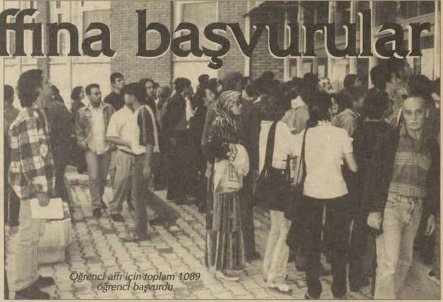
Öğrenci affı için toplam 1089 öğrenci başvurdu

Mühendislik-Mimarlık Fakültesi 10 Devlet Konservatuvarı 1 Beden Eğitimi ve Spor Yüksekokulu 2 Sivil Havacılık Yüksekokulu 10 Turizm ve Otel İşletmeciliği Yüksekokulu 33 Eskişehir Meslek Yüksekokulu 18 Bilecik Meslek Yüksekokulu 54 Bozüyük Meslek Yüksekokulu 25 Sosyal Bilimler Enstitüsü 328 Fen Bilimleri Enstitüsü 13 ve Eğitim Bilimleri Enstitüsü 8 toplam 1089 öğrenci başvurdu.