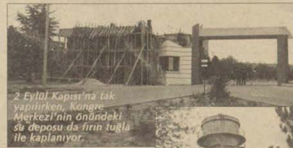
2 Eylül Kapısı'na tak yapılıyor. Kongre Merkezi'nin önündeki su deposu da firin tuğla ile kaplanıyor.

halen süren İki Eylül Kapısı'na 'tak' yapımının sürdüğünü hatırlatan Ustaoglu, bunun yanı sıra huvuz yapımının ise tamamlandığını söyledi. Lojmanların arkasında bulunan ve İstiklal Kapısı olarak bilinen kapının yol bağlantısının tamamlandığını belirten Ustaoglu, ayrıca Rehberlik ve Psikolojik Danışma Merkezi ek bina inşaatının da sürdüğünü ifade etti.