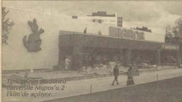
Türkiye'nin dördüncü üniversite Migros'u 2 Ekim'de açılıyor.

09.00-20.00 saatleri arasında hizmet verecek. Öte yandan, Migros'un yanına bir de Burger King açılırken, Migros binasının bodrum katı da üniversite arşivi olarak kullanılacak.