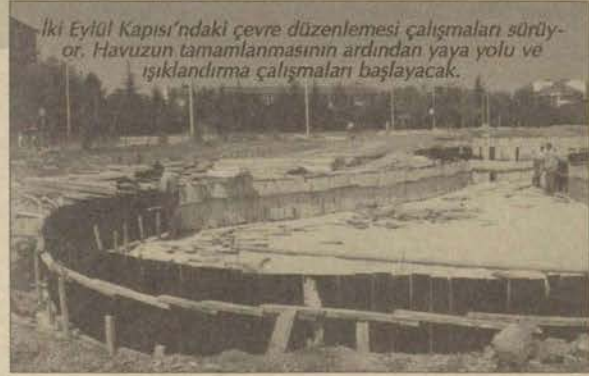
İki Eylül Kapısı'ndaki çevre düzenlemesi çalışmaları sürüyor. Havuzun tamamlanmasının ardından yaya yolu ve aydınlatma çalışmaları başlayacak.

park alanının yanına bir havuz yapıldığını, havuz inşaatının ardından da yaya yolu ve aydınlatma çalışmalarına başlanacağını ve giriş kapısına Cumhuriyet Kapısı'nda olduğu gibi bir 'tak' yapılmasının ardından çalışmaların tamamlanacağını söyledi. Ustaoglu, Teknopark'ın önüne de bir havuz yapıldığını ve bu tür çevre düzenlemelerinin önümüzdeki günlerde de devam edeceğini belirtti.