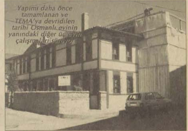
Yapımı daha önce tamamlanan ve TEMA'ya devredilen tarihi Osmanlı evinin yanındaki diğer üç evin çalışmaları sürüyor