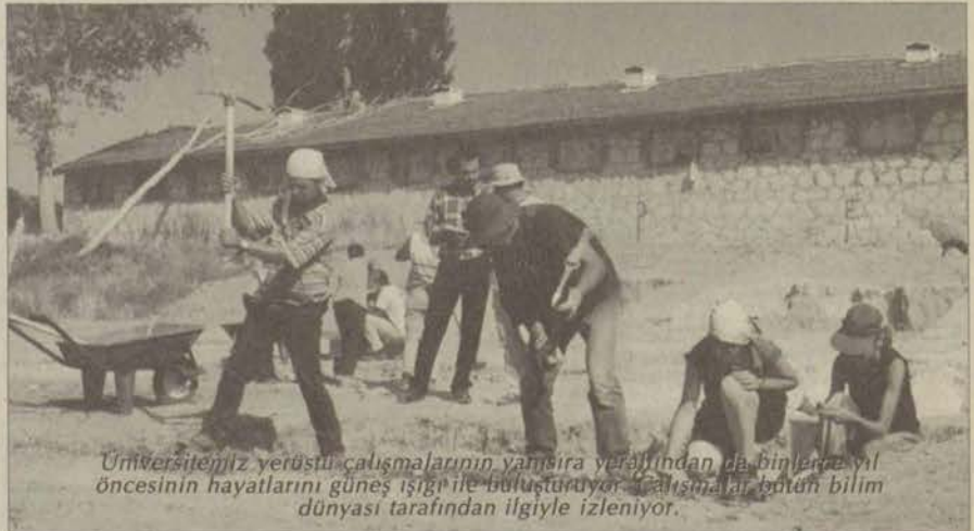
Üniversitemiz yerüstü çalışmalarının yanı sıra yeraltından da binlerce yıl öncesinin hayatlarını güneş ışığı ile buluşturuyor. Çalışmalar bütün bilim dünyası tarafından ilgiyle izleniyor.

yal olarak destekliyor. Bir yandan yaptığı arkeolojik çalışmalar ile şehrin tarihi ortaya çıkarılıyor, tarihi binalar koruma altına alınıyor. Çevre düzenlemesine de ağırlık veren üniversitemiz, kötü günlerde de şehrin yardımına koşuyor.