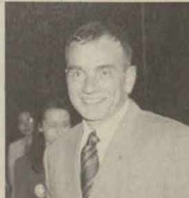
İnternette reklam mı?