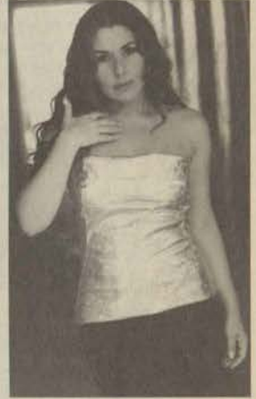
Türk pop müziğinin son 30 yılına damgasını vuran sanatçılardan birisi olan Nilüfer, bu yılki mezuniyet töreninin dikkat çeken ismi

Sevinç ve hüznün beraber yaşanacağı mezuniyet töreninde binlerce öğrenci havai fişek gösterileri ile güzel bir finale tanık olacak.