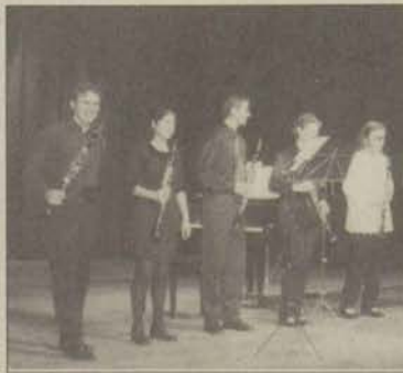
Konser sonunda alkışlarla iki kere sahneye çağrılan genç klarnetçiler, gösterdikleri üstün performansla gelecek için umut verdiler