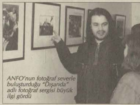
ANFO'nun fotoğraf severle buluşturduğu "Dışarıda" adlı fotoğraf sergisi büyük ilgi gördü

Bir çok ülkeden 11 üyesi bulunan KFF, 9 başlık altında topladığı sergide "an'ı vurguluyor. KFF üyelerinden biri olan Kemal Cengizkan kopratifile ilgili olarak "Biz koperatif kelimesini hep kötü örneklerden biliyoruz.