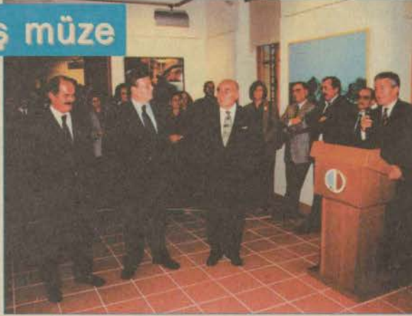
Çağdaş Sanatlar Müzesi'nde Anadolu Üniversitesi koleksiyonundaki eserler sergilenecek.

Kültür Bakanlığı Müsteşarı Fikret Üçcan da yaptığı konuşmada Çağdaş Sanatlar Müzesi ile Anadolu Üniversitesi'nin bir ilke daha imza attığını belirterek, Kültür Bakanlığı olarak Anadolu Üniversitesi'nin böylesi kültür ve sanat projelerine destek olacağını söyledi.