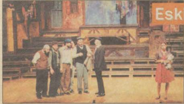
Keşanlı Ali Destanı sezonuna kadar salı ve perşembe günleri sabnelenecek.