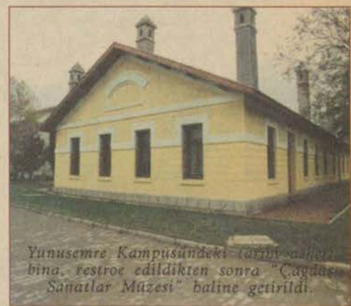
Yunusmare Kampüsündeki tarihi askeri bina, restore edildikten sonra "Çağdaş Sanatlar Müzesi" haline getirildi.