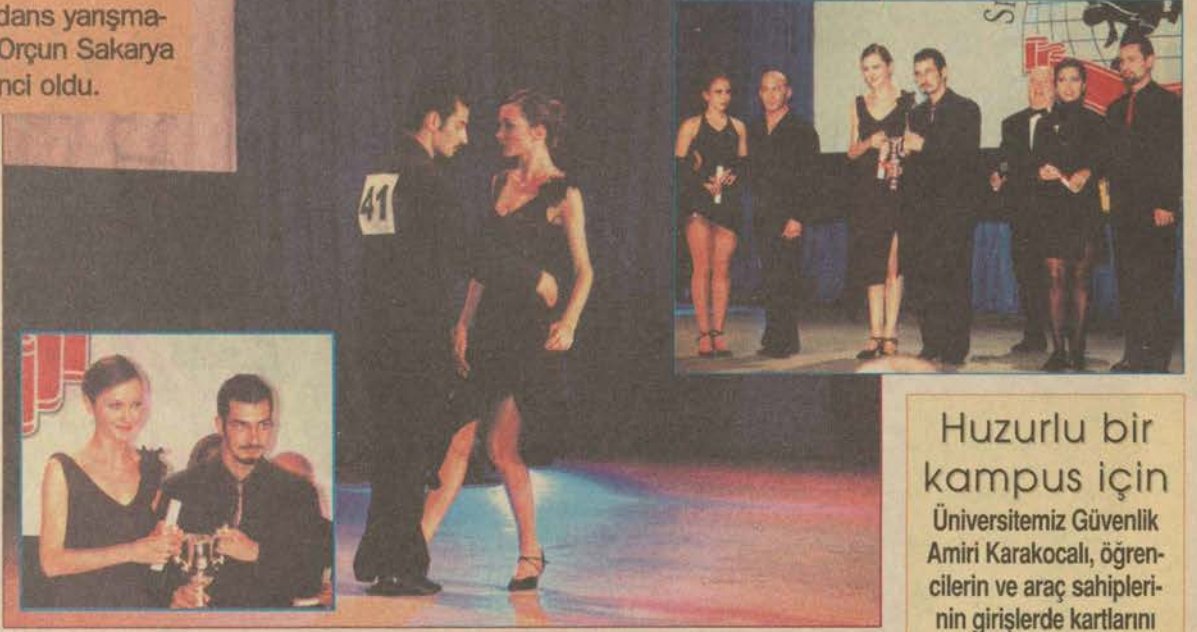
Anadolu Üniversitesi'nin iki öğrencisi, Türkiye'de ilk kez düzenlenen dans yarışmasında birincilik ödülü kazandı.

Huzurlu bir kampus için Üniversitemiz Güvenlik Amiri Karakocalı, öğrencilerin ve araç sahiplerinin girişlerde kartlarını göstermelerini istedi.