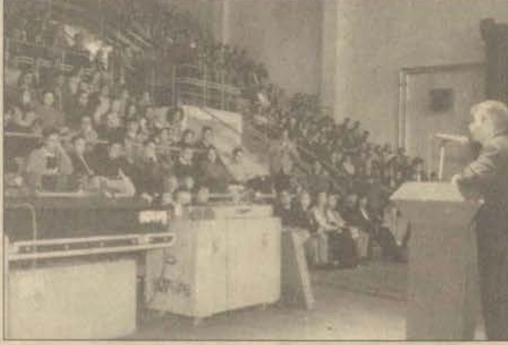
Daha önce yapılan programlara öğrenciler büyük ilgi göstermişti.