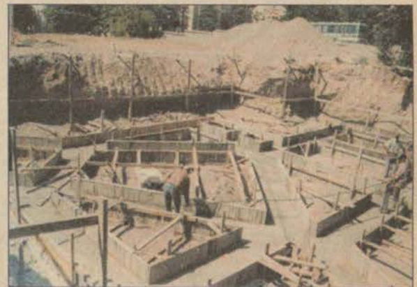
Kantin yeni öğrenci yılının ikinci yarısında hizmet vermeye başlayacak.

Teknopark ile yüzme havuzu arasında yer alan açık spor merkezlerinin yanına da bir fastfood res-