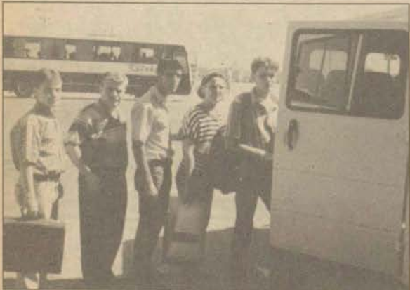
Anadolu Üniversitesi'nin araçları öğrencileri kayıt yaptıracakları birime kadar götürecektir.