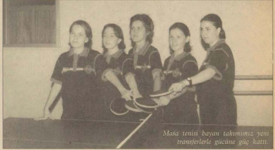
Masa tenisi bayan takımımız yeni transferlerle gücüne güç kattı.

Uluslararası Masa Tenisi Federasyonu (ETTU)'nun masa tenisini daha ilgi çekici hale getirmek için oyun kurallarında değişiklik yaptığını ve bu kuralların Eylül ayında geçerli olacağını ifade eden Aksöz, "11'li sayı sistemine geçildi. İki oyuncu arasındaki karşılaşma beş