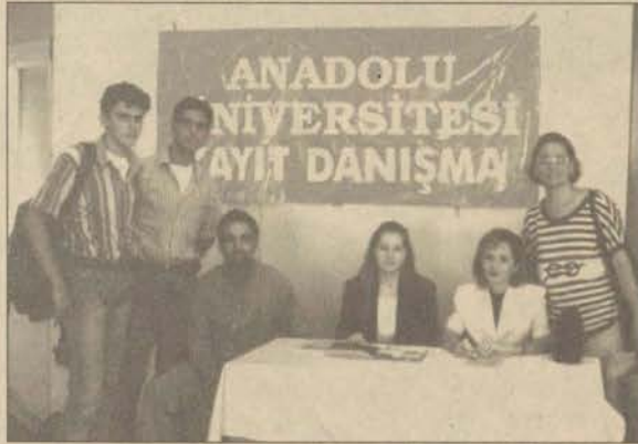
Uygulama öğrencilere büyük kolaylıklar sağlıyor.

13-19 Eylül günleri arasında yapılacak kayıtlar boyunca Şehirlerarası Otobüs Terminali ile İstasyon'a kurulacak masalarda öğretim elemanları görev yapacak. Anadolu Üniversitesi'nin araçları