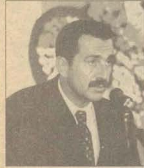
Tepebaşı Belediye Başkanı Ahmet Ataç.

Tepebaşı Belediyesi tarafından düzenlenen ve Anadolu Üniversitesi'nin de katkıda bulunduğu 1. Uluslararası Pişmiş Toprak Sempozyumu 15 Ağustos günü düzenlenen törenle başladı.