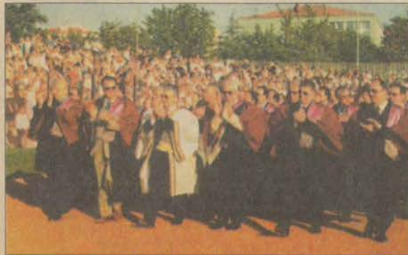
Öğretim üyeleri Atatürk Stadyumu'na konukların alkışları arasında girdiler.