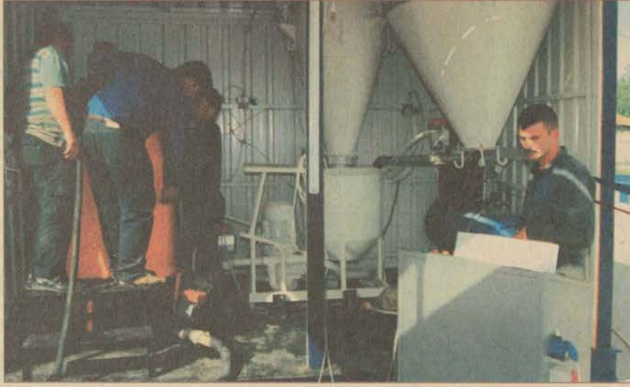
Anadolu Üniversitesi İnşaat Mühendisliği Bölümü, Türkiye'de ilk defa Jet Grout zemin iyileştirme makinesi yapmayı başardı.

Şimdiye kadar Jet Grout zemin iyileştirme makinesi-