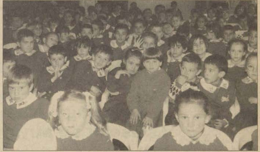
Öğrenciler, deprem konusunda çeşitli bilgiler alıyorlar.