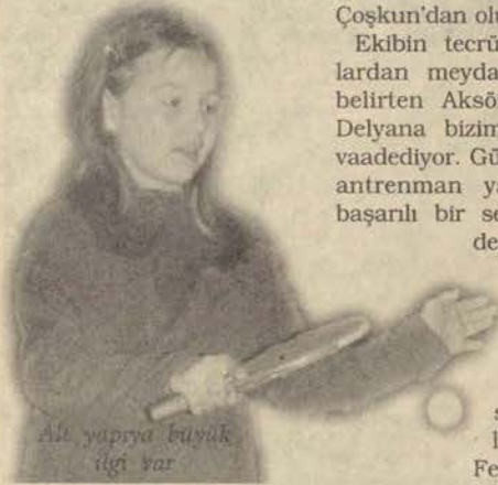
Altı yapma büyük ilgi var