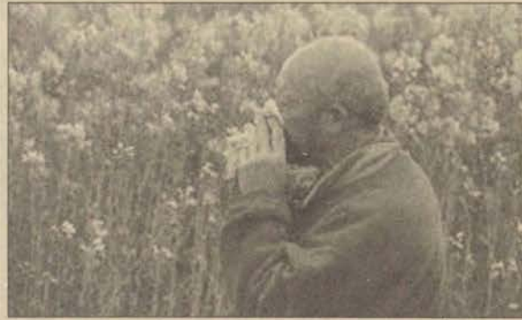
Alerji bahar aylarında pek çok kişiyi etkiliyor.

*Aniden ortaya çıkan şiddetli veya tekrarlayan öksürük, hırıltı, nefes darlığı nöbeti yaşıyorsanız,