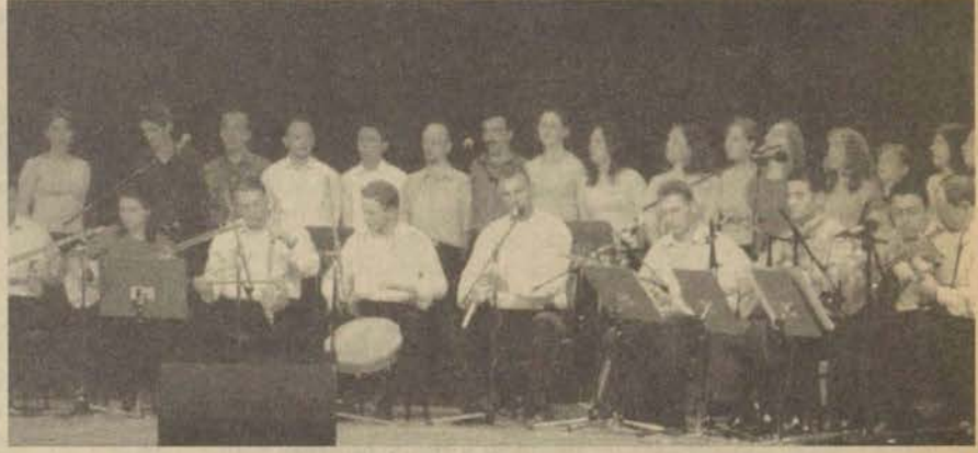
Konserin sonlarına doğru konuklar kendilerini eğlenceye kaptırarak halay çektiler.