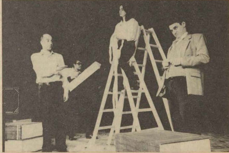
Tiyatro Anadolu'nun oyunlarına en fazla öğrenciler ilgi gösteriyor.