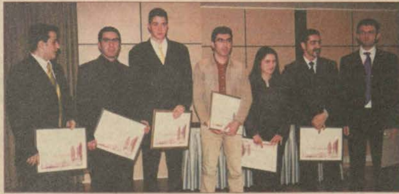
Güzel Sanatlar Fakültesi Grafik Bölümü öğrencileri ödüllere ambargo koydu

Güzel Sanatlar Fakültesi daha önce de aynı yarışmada Afiş dalında birincilik ve ikincilik ödüllerini kazanmıştı.