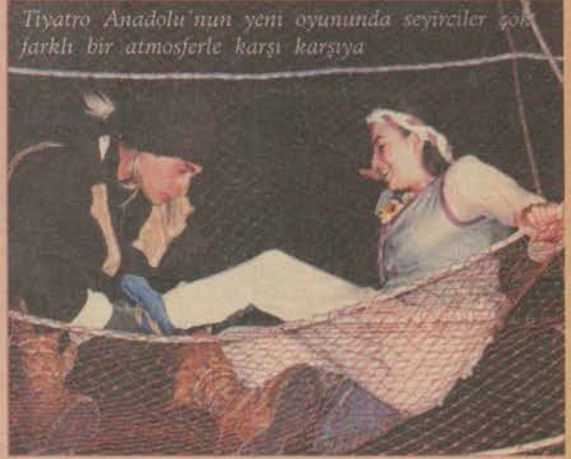
Tiyatro Anadolu'nun yeni oyununda seyirciler göz kamaştırıcı bir atmosferle karşı karşıya