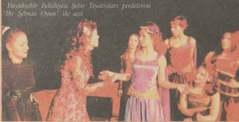
Büyükşehir Belediyesi Şehir Tiyatroları perdelerini "Bir Şehnaz Oyun" ile açtı