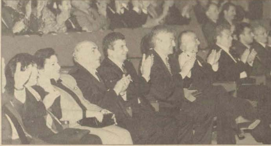
Halk Dansları Topluluğunun konferans çerçevesinde 1 Nisan akşamı yaptığı "Yereleden Eyerensele Anadolu" gösterisini Kültür Bakanı İstemihan Talay da izledi

Konferansın açılışında bir konuşma yapan Kültür Bakanı İstemihan Talay, Avrupa'nın ABD sinemasının hegemonyasından şikayetçi olduğunu bildiren, bu durumun Türkiye'yi de etkilediğini belirtti. Talay, "Kendi ürünlerimizi kaybetme tehlikesiyle karşı karşıyayız. Bunun engellenmesi lazım. Bunun yaparken de herşeyi dev-