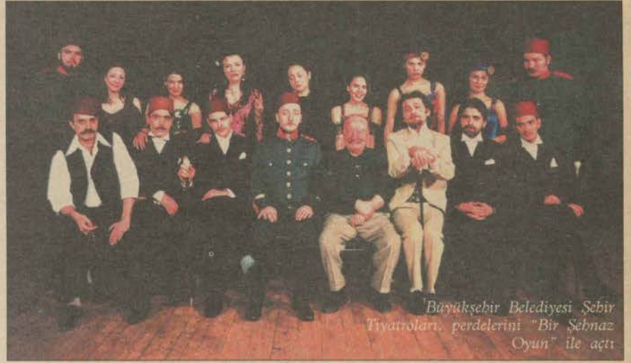
Büyükşehir Belediyesi Şehir Tiyatroları, perdelerini "Bir Şehnaz Oyun" ile açtı

Belediyenin ve siyasilerin giderek tiyatroya karşı tavrı alması ve yapılan etkinlikleri gereksiz görmesi nedeniyle tiyatro sevdası kesintiye uğrar.