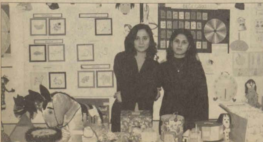
Eğitsel Araç-Gereçler Sergisi'nde öğrencilerin hazırladıkları eserlerle salon adeta bir oyuncakçı dükkanına döndü