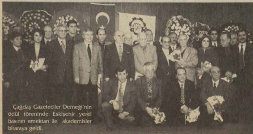
Çağdaş Gazeteciler Derneği'nin ödül töreninde Eskişehir yerel basının emekleri ile akademisler biraraya geldi.