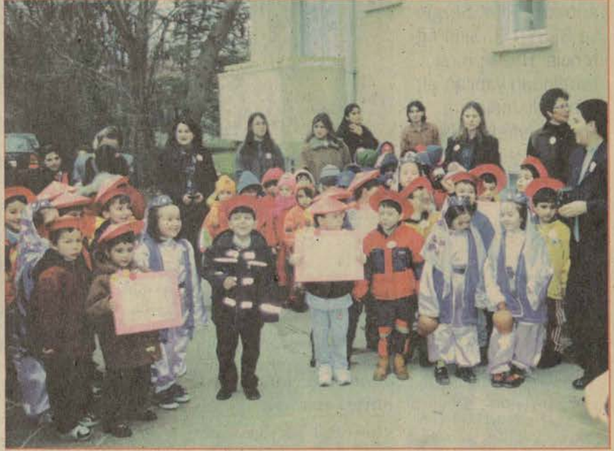
Yeni binanın açılışı öğrencilerin ve velilerin katılımıyla gerçekleştirildi.