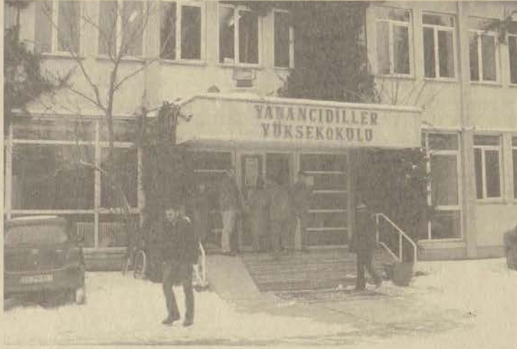
Yabancı Diller Yüksekokulu, beşinci yılına girdi.