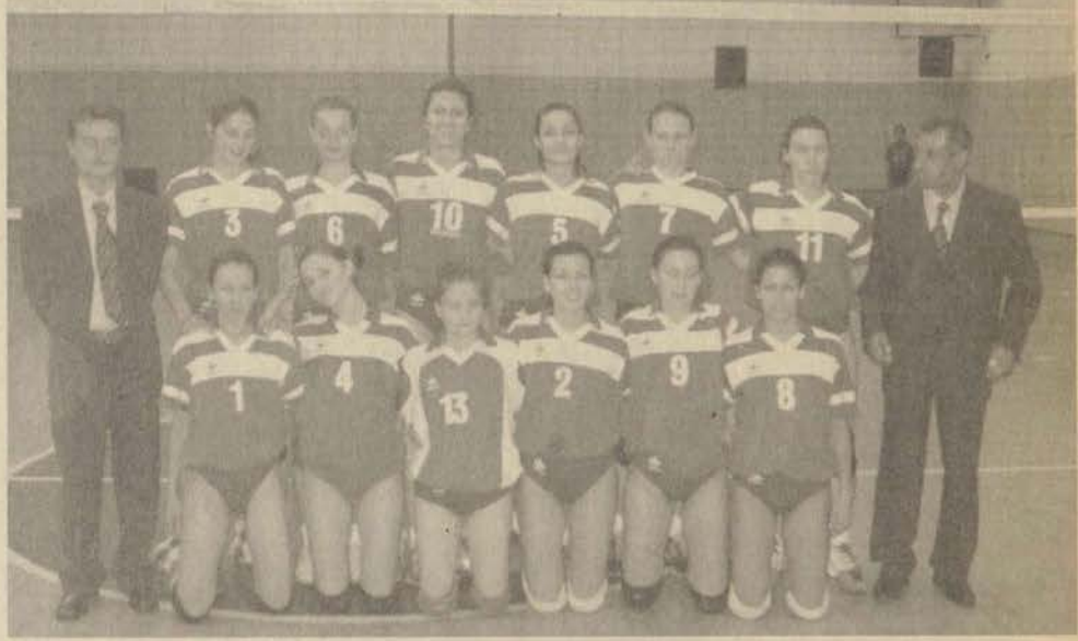
Bayan voleybol takımımız, ligde oynadığı altı maçını da kazanarak ilk dört için iddiasını ortaya koydu.

Bayan voleybol takımımız önümüzdeki hafta deplasmanda Bursaspor ile karşılaşacak.