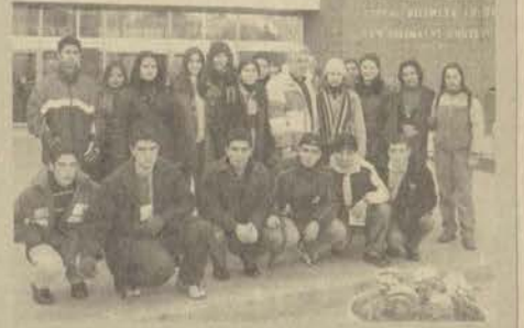
Lise öğrencilerinin Anadolu Üniversitesi'ne olan ilgisi devam ediyor. Üniversitemizin konukları bu kez Aydın Nazilli Anadolu Öğretmen Lisesi öğrencileriydi.

Anadolu Üniversitesi 13 Aralık Cuma günü Aydın Nazilli Anadolu Öğretmen Lisesi öğrencilerini konuk etti. Konuk öğrenciler, Basın ve Halkla İlişkiler Müdürlüğü'nden Anadolu Üniversitesi hakkında bilgi aldıktan sonra, Kongre Merkezi'nde üniversiteyi tanıtan bir slayt gösterisi izlediler. Konuk öğrenciler Güzel-Sanatlar Fakültesi, Çağdaş Sanatlar Müzesi ve üniversitemizin çeşitli birimlerini gezerek bilgi aldılar.