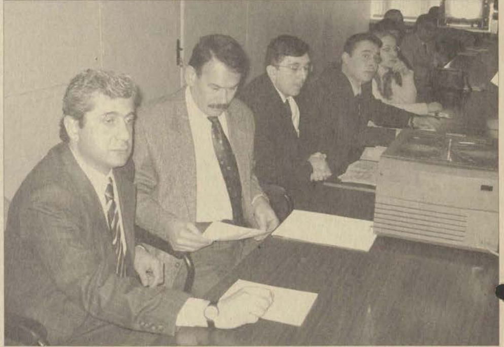
Eczacılık Fakültesi 34'üncü kuruluş yıldönümünü bir dizi bilimsel etkinlikle kutladı.