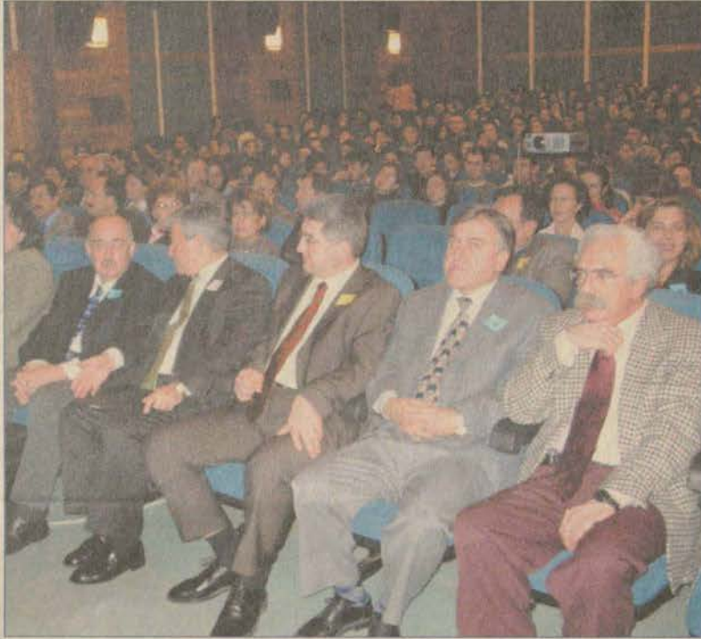
Öğretmenler Günü dolayısıyla düzenlenen törene eski Devlet Bakanlarından Tınaz Titiz de katılarak bir konferans verdi.