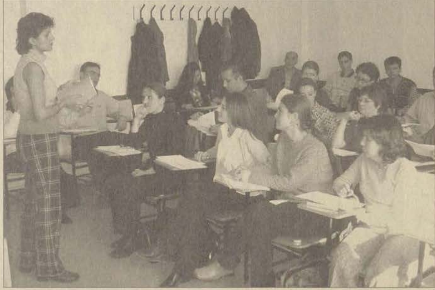
Her yıl bir kez düzenlenen kursa bu dönem 165 öğretim elemanı katılıyor.