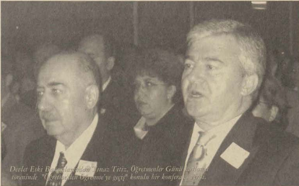
Devlet Eski Başbakanlarından Tınaz Titiz, Öğretmenler Günü'nü kutlarken töreninde "Öğretmenden Öğrenme'ye geçiş" konulu bir konferans verdi.