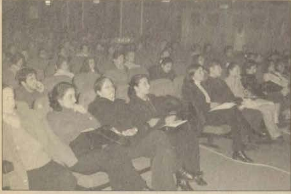
Akademik Fırsatlar paneline öğrenciler büyük ilgi gösterdi.

Başarılı 1'de "Üniversite içi yatay geçiş yapabilmeniz için, ilk iki yarıyıl tamamlanmış ve bu iki yarıyıldan almış olduğunuz bütün dersleri başarıyla almış, disiplin cezası almamış olmanız gerekir. Bu durumda üçüncü yarıyılın başında ilgili birime başvurabilirsiniz. Diğer yandan ikinci öğretimden birinci öğretime, birinci öğretimden ikinci öğretime yatay geçişler, Yükseköğretim Kurulu'na belirlenen esaslar doğrultusunda yapılır".