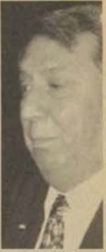
Milli Eğitim Bakanı Prof. Dr. Necdet Tekin

Anadolu Üniversitesi 2002 yılı Bilim-Teknoloji, Sanat ve Hizmet Ödüllerinin verilmesinin ardından tören Çökesli Gençlik Korusu tarafından Anadolu Üniversitesi Marşı'nın okunmasıyla sona erdi.