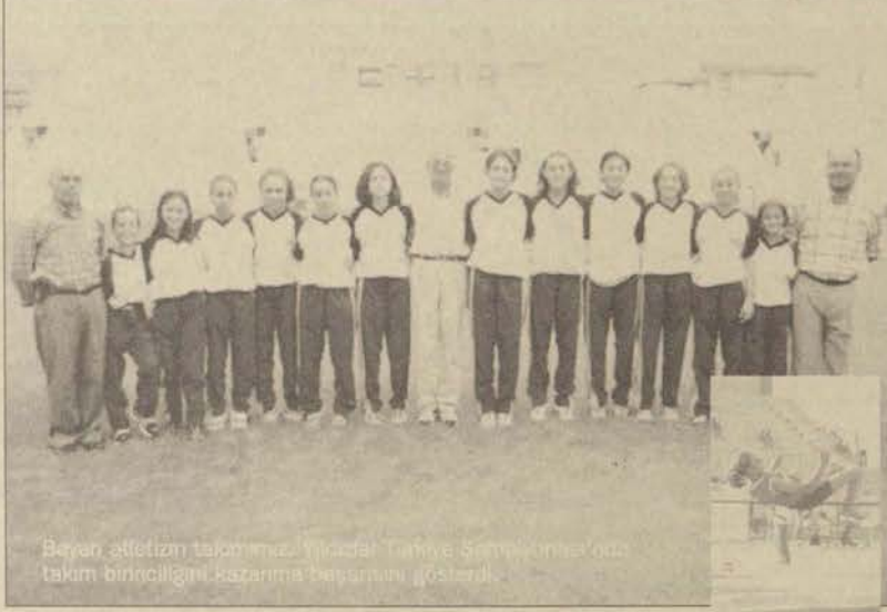
Bayan atletizm takımımız, Yıldızlar Türkiye Şampiyonası'nda takım birinciliğini kazanma başarısını gösterdi.

Antrenör Şükrü Saban "Gelecek için büyük umut veren yıldız takımımızın Türkiye birinciliğini alması önemli bir başarı. İleriki yıllarda A Takımı oluşturacak olan bu gençlerle daha nice büyük başarıları imza atacağız" dedi.