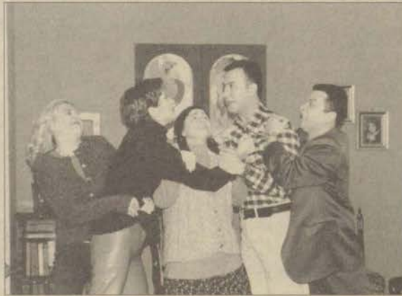
TRT'nin "Ayrılıkta Beraberiz" dizisi de ilgi görenler arasında.

İletişim Bilimleri Fakültesi Sinema-Televizyon Bölümü öğre-