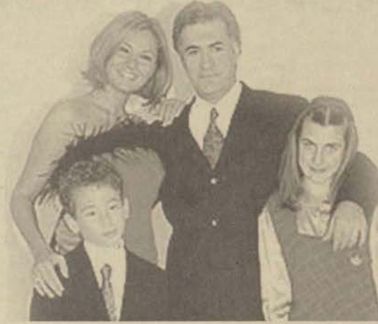
"Çocuklar Duymasın" adlı dizi yerli durum komedilerine iyi bir örnek olarak gösteriliyor.