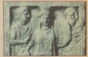
Efes'te kutsal alan çalışması