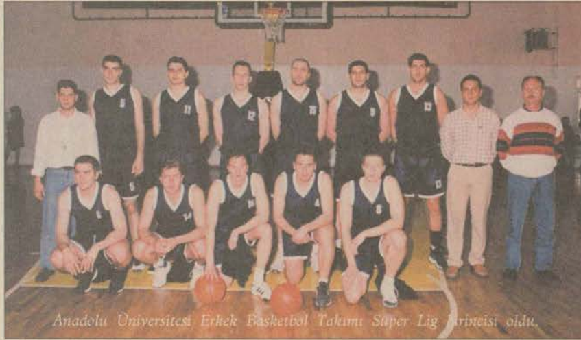
Anadolu Üniversitesi Erkek Basketbol Takımı Süper Lig birincisi oldu.

İstanbul'daki çeşitli üniversitelerde 1-10 Temmuz günleri arasında yapılan oyunlarda sporcularımız, bireysel ve takım sporlarında 25 madalya alırken, Erkek Basketbol Takımımız da Süper Lig birinciliğini kazanarak büyük bir başarıya imza attı. Sporcularımızın mücadele ettiği dallar ve aldıkları dereceler şöyle: