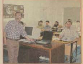
Çağdaş yaşama Anadolu desteği

Üniversitemiz futbol takımı Süper Lig müsabakalarında dereceye giremedi. Takımımız bu sonuçla Deplasmanlı Bölgesel 1. Lige düştü.