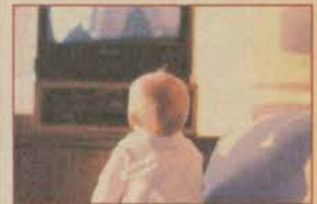
Televizyon çocuğun yaşamından çalıyor