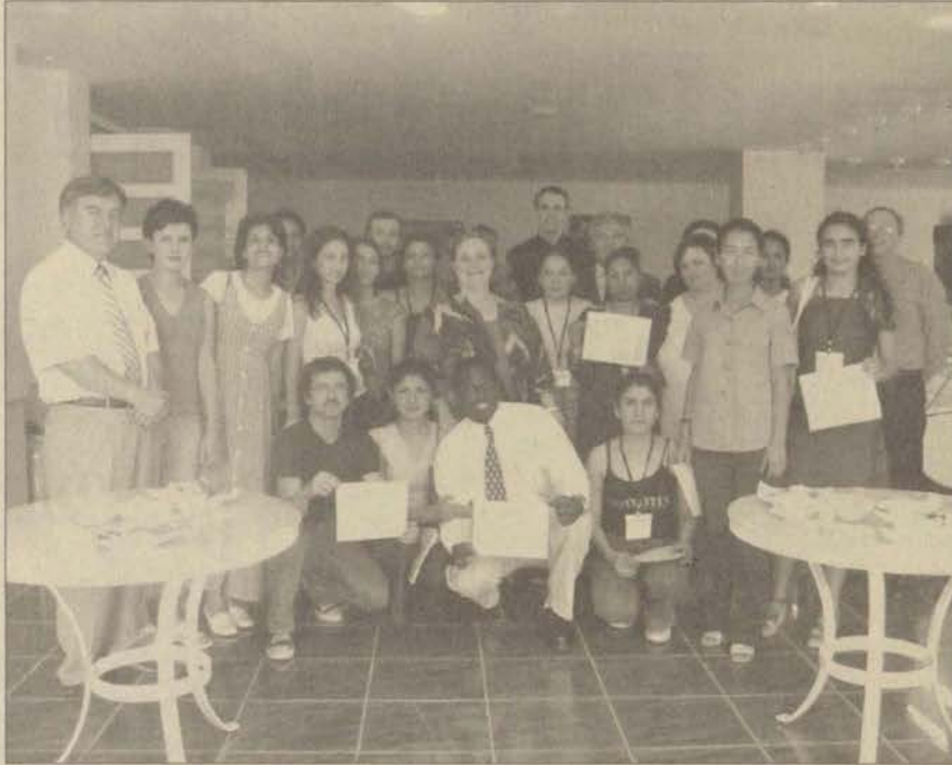
Açıköğretim Fakültesi'nin bu yıl ilk kez düzenlediği yaz okuluna İngiltere'den beş öğrenci ve bir öğretim üyesi de konuk olarak katıldı.