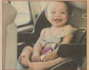
Çocuklarla yolculuk rehberi