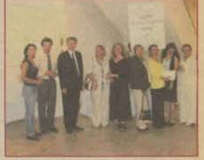
Exlibris yarışma sergisi Anadolu'da