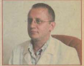
Yaz hastalıklarına dikkat!