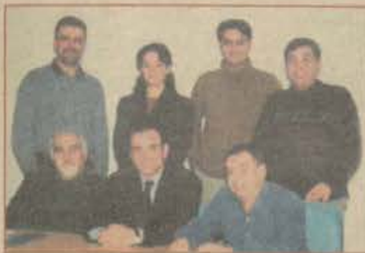
Mezunlar Birliği, eğitim birimleriyle bir araya geldi.