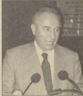
Millî Eğitim Bakanı Metin Bostancıoğlu