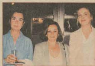
Sinema Günleri'nde ünlü konuklar