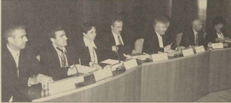
Açık ve Uzaktan Eğitim Sempozyumu'nda 10'u dış ülkelere 154 katılımcı yer alırken, sempozyum boyunca toplam 101 bildiri sunuldu.