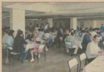
İİBF mezunları Pırlav Günü'nde buluştu