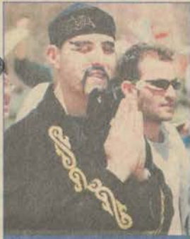
Öğrenciler ilginç kıyafetleriyle yürüyüşe renk kattı.