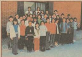
ANADOLU'DAN GENÇLERE YARDIM