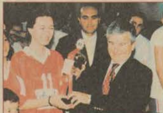
KUPALARDA İİBF FIRTINASI ESTİ