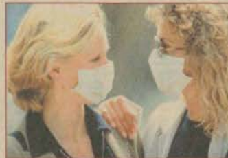
BAHAR BAZEN KAŞINDIRIR