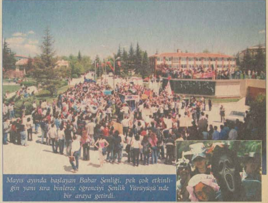
Mayıs ayında başlayan Bahar Şenliği, pek çok etkinliğin yanı sıra binlerce öğrenciyi Şenlik Yürüyüşü'nde bir araya getirdi.