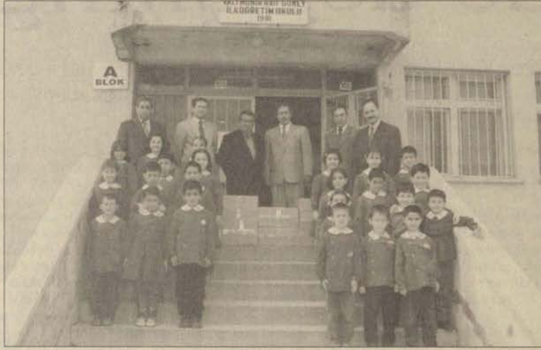
Eğitim Fakültesi, pek çok öğrencisinin staj yaptığı Vali Münir Raif Güney İlköğretim Okulu'na bu kez koliler dolusu kitapla geldi.