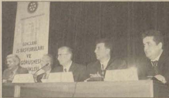
Konuşmacılar, iş bulma konusunda öğrencilere gelecekte yararlı olacak bilgiler verdiler.

Seminerde ana hatlarıyla, hazırlık, iş başvurusunun yapılması ve iş görüşmesi aşamaları ele alındı. İsmet Erdener; bir işe başvururken öncelikle hedeflerin saptanmasından, iş bulma kaynaklarından ve görüşmeye