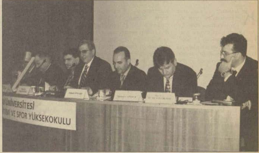
BESYO'nun düzenlediği panelde, Türk hentbolünün sorunları ve geleceği tartışıldı.