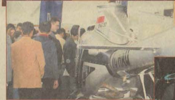
Tanıtım programında büyük ilgi gösteren üniversite adayları, Spor Salonu'na girebilmek için zaman zaman uzun kuyruklar oluşturduklar. (Üstte)