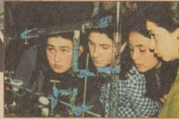
Sivil Havacılık Yüksekokulu'nun Spor Salonu'na getirdiği helikopter, konuk öğrencilerin büyük ilgisini çekti. (Üstte) Öğrenciler, eğitim birimlerinin açtığı standlardaki tanıtımları meraklı gözlerle izlediler. (Sağda)