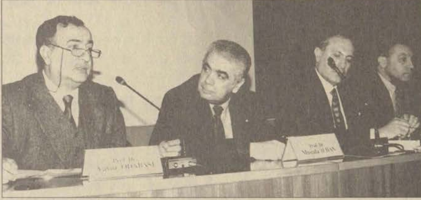
Bilimsel etik sorununun detaylarıyla tartışıldığı panele öğretim elemanlarının ilgisi büyüktü.

Bilimsel araştırma ve yayın etiğinin ele alındığı panele, Türkiye Bilimler Akademisi ve TÜBİTAK üyeleri konuşmacı olarak katıldı.