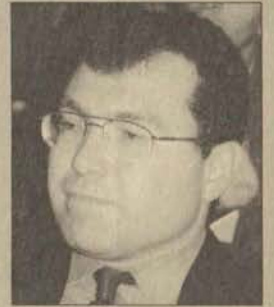
Prof. Dr. Hasan Mandal

Gençleri bilim ve araştırma alanlarına yönleltmek; bilim ve araştırmacı standartlarının uluslararası düzeye çıkartılmasına yardım etmek amacıyla kurulan ve Türkiye'nin en saygın bilim kuruluşlarının başında gelen TÜBA tarafından başlatılan bu programın amacı, Sağlık, Fen ve Sosyal Bilimler alanının da çalışan başarılı insanları ve onların çalışma gruplarını kapsayan ve üç yılda bir yenilenen bir ağ oluşturmak ve yaklaşık 20 yıl sonra ülkemize yetkin bir araştırmacı grubu kazandırmak. Prog-