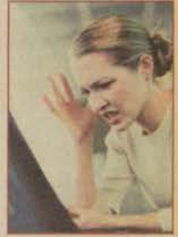
Bilgisayar esareti bedeni yıpratıyor