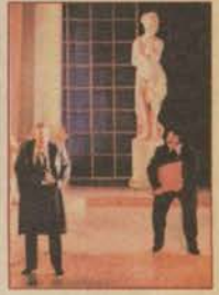
Yarasa, Anadolu'da uçtu