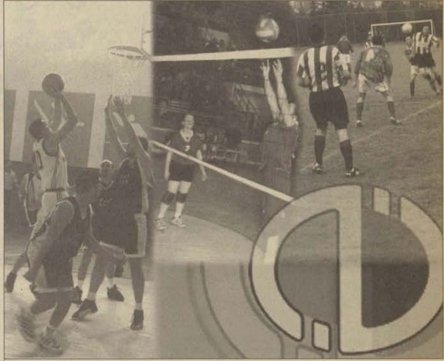
Spor etkinliklerinde bu yıl toplam 71 ekip mücadele edecek.