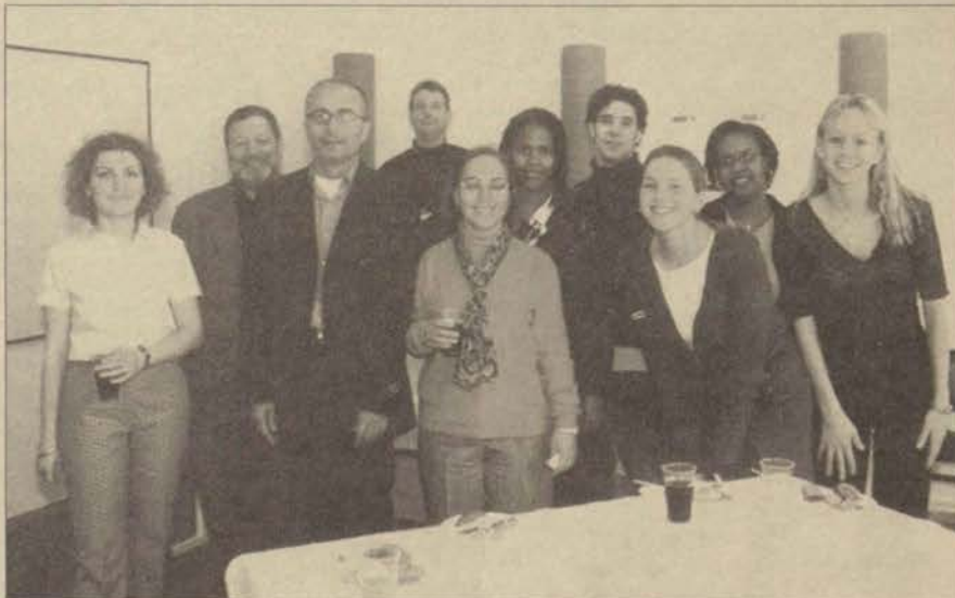
Amerikalı konuklar Anadolu Üniversitesi'nden çok etkilendiler.