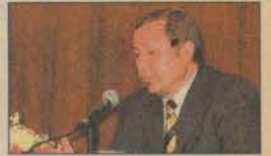
Tasarruflar yastık altında saklanıyor

Başboğa, her türlü sorunları için öğrencilerin Temsilciler Kurulu ile bağlantı kuralmasını beklediklerini kaydetti.