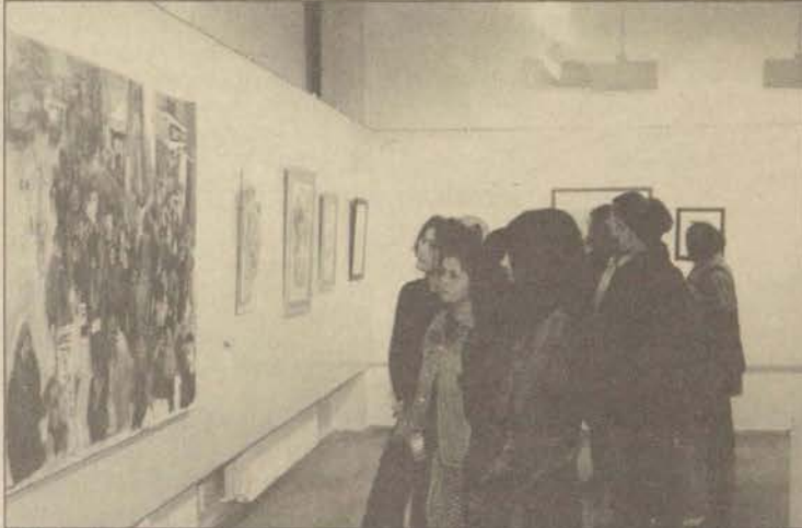
Dünya Kadınlar Günü için açılan sergide bu kez bayların çalışmalarını da yer aldı.