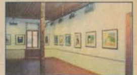
Bu müze sizin ziyaretinizi bekliyor