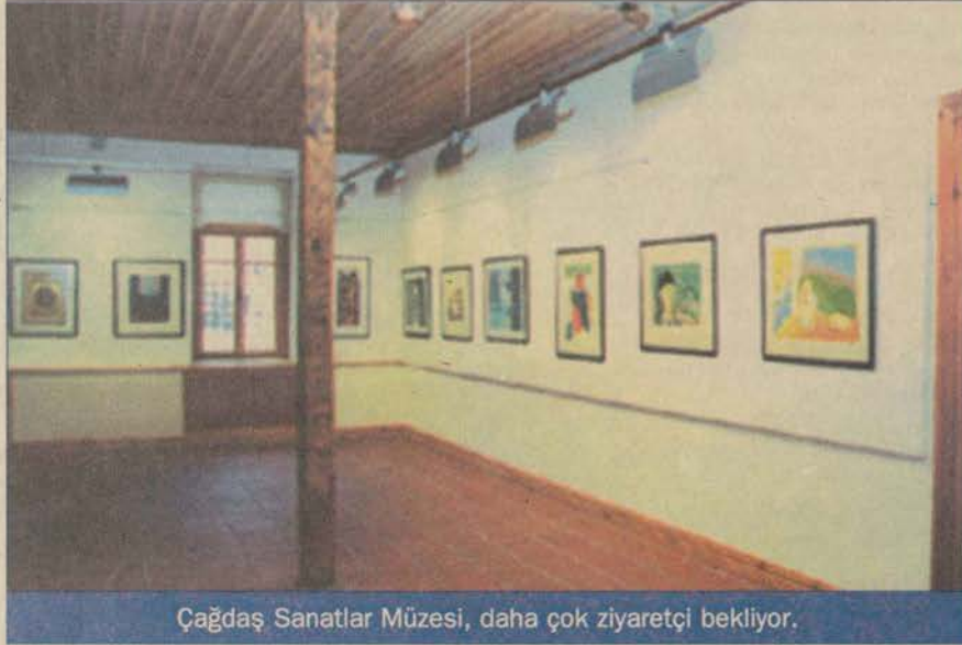
Çağdaş Sanatlar Müzesi, daha çok ziyaretçi bekliyor.