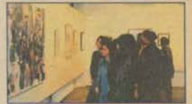
Kadınlar Günü Sergisi'ne erkek sanatçılardan destek