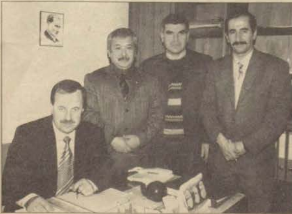
Ulaştırma ve Otobakım Atelyeleri, yapılan tasarrufla yüzde 70 yakıt tasarrufu sağladı.

Geçtiğimiz yıl şehir içinde ve dışında çeşitli etkinlikler için 950 bin kilometre yol kateten Ulaştırma Servisi, alınan önlemler sayesinde de yüzde 70'e varan yakıt tasarrufu sağladı.