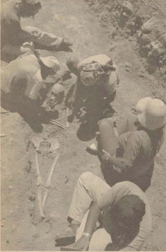
Kelenderis antik kentinde bu çalışma döneminde ortaya çıkarılan buluntular, tartışılan pek çok konuyu aydınlığa kavuşturacak.