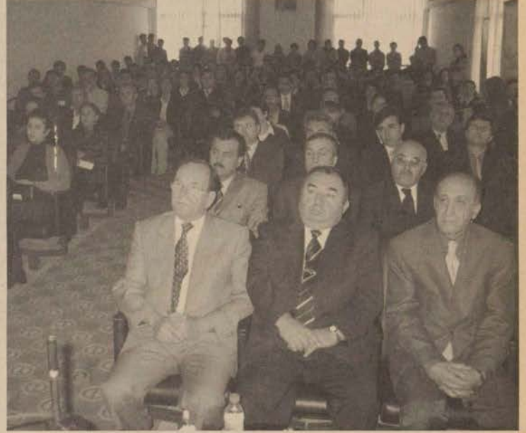
Bilecik Meslek Yüksekokulu'nda düzenlenen panelde konuşmacılar Afrika'da her üç kişiden birinin açlık sorunu yaşadığına dikkat çektiler.

kir Poyraz da Asya'da her dört kişiden, Sahra'nın güneyindeki Afrika'da ise her üç kişiden birinin açlık çektiğini ve her 6 kişiden birinin okuma-yazma bilmediğini ifade etti. Her dakikada bir anneni yaşamını yitirdiğine işaret eden Poyraz, tüberküloz, sıtma ve AIDS'in milyonlarca insanı tehdit ettiğini vurguladı. Yard. Doç. Dr. Poyraz, bu kötü tablonun öncelikle çocukları etkilediğini söyledi. Tarım İl Müdürlüğü ve Eti Gıda Anonim Şirketi'nin slayt gösterilerinin de yer aldığı programın sonunda, Dünya Gıda Günü dolayısıyla düzenlenen resim ve kompozisyon yarışmasında dereceye giren öğrencilere ödülleri verildi.