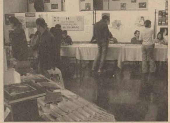
Bilim Şenliği'nde konferansların yanı sıra sergiler ve dia gösterileri de yer aldı.

Gözcüoğlu ise "Türkiye Denizleri'nin Biyoçeşitliliği" konularında birer dia gösterisi sundular.