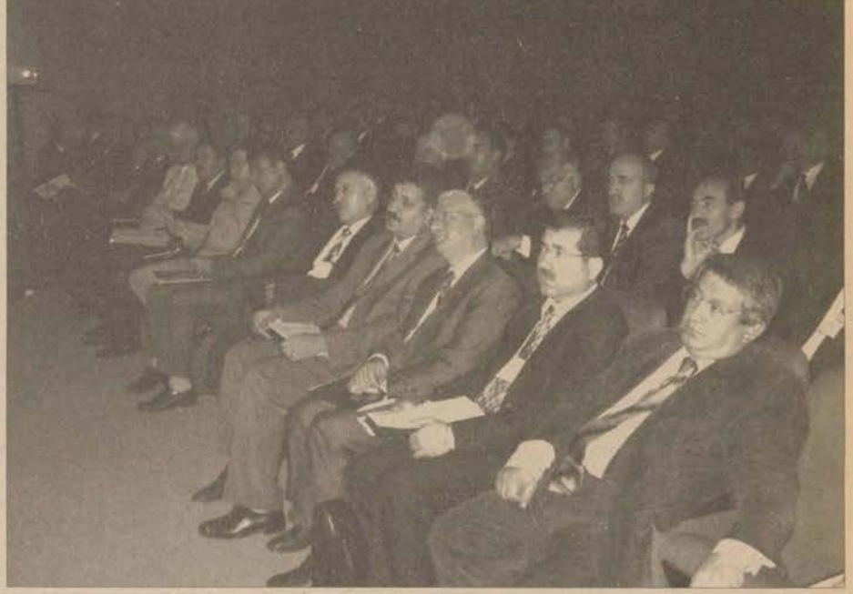
Toplantıya 100'e yakın İl Millî Eğitim Şube Müdürü ile AÖF ve Eğitim Fakültesi'nden öğretim elemanları katıldı.