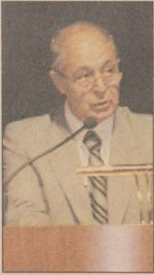
Cumhurbaşkanı Ahmet Necdet Sezer, özgür bir düşünce ortamının merkezi yönetimle sağlanamayacağını vurguladı.

Yeni ders yılı açılış törenine onur konuğu olarak katılan Cumhurbaşkanı Ahmet Necdet Sezer, Anadolu Üniversitesi'nin dünya çapında bir üniversite olduğunu ve Türkiye'nin çağdaşlaşma sürecine büyük katkıları olduğunu söyledi. Sezer, özgür bir düşünce ortamının merkezi yönetimle sağlanamayacağını vurguladı.