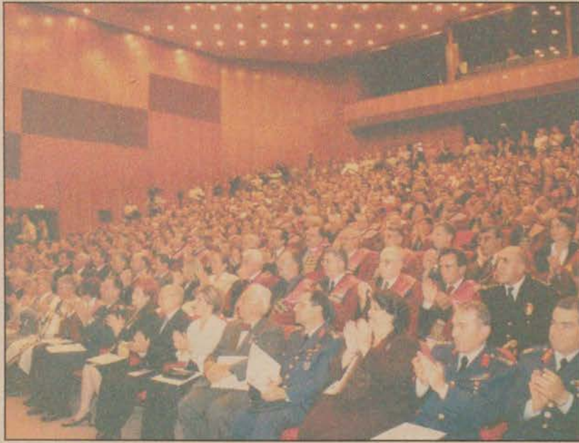
Açılış töreninde konuklar, öğretim elemanları ve öğrenciler bir araya geldi.