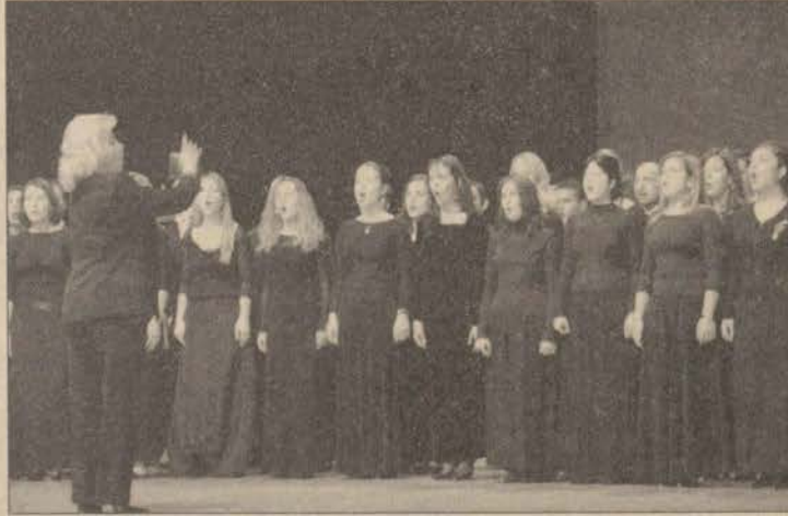
Çok Sesli Gençlik Korosu, İstiklal Marşı ve Anadolu Üniversitesi Marşı'nı seslendirdi.