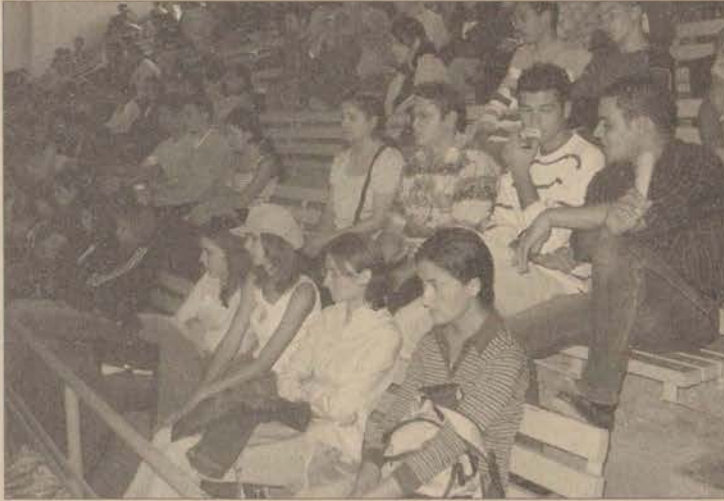
Oryantasyon Programı'na yeni kayıt yaptıran öğrenciler büyük ilgi gösterdi.