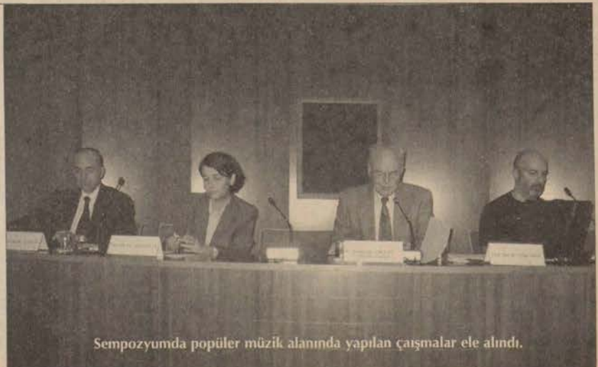
Sempozyumda popüler müzik alanında yapılan çalışmalar ele alındı.