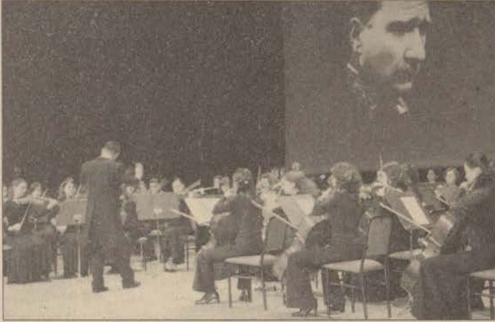
Devlet Konservatuvarı Gençlik Senfoni Orkestrası törende bir dinleti sundu.

"Yükseköğretim Yasa Taslağı, iyi bir üniversite için koşul olan özgürlük, özerklik ve liyakat bakımından gereksinim duyulan bir model getirmemektedir. Ayrıca, yeni taslak aşırı merkezizetçidir. Tüm üniversite ve birimlerini aşırı kalıplar içinde örgütlemeyi ve yürütmeyi amaçlamakta, siyasetleşme tehlikesi taşımaktadır. Buna karşın, dünyanın bugün geldiği noktanın tek tip üniversite modeli değil, her üniversitenin farklı bir misyonunun ve farklı önceliklerinin olmasıdır. Bu bağlamda yapılması gereken, anayasa ve yasalar