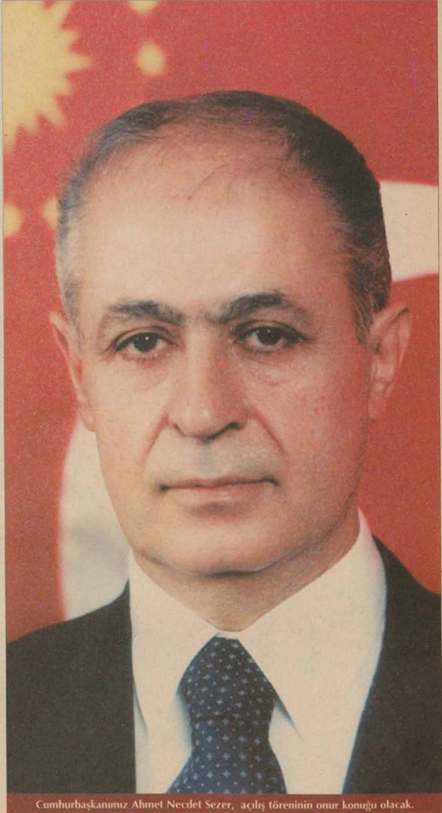
Cumhurbaşkanımız Ahmet Necdet Sezer, açılış töreninin onur konuğu olacak.