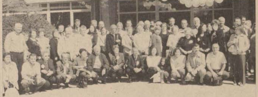
Mezunlar Eczacılık Fakültesi'nin 35'inci yıl kutlamasında bir araya geldiler.