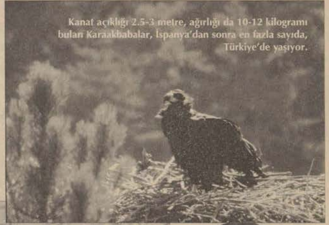
Kanat açıklığı 2.5-3 metre, ağırlığı da 10-12 kilogramı bulan Karaakbabalar, İspanya'dan sonra en fazla sayıda, Türkiye'de yaşıyor.