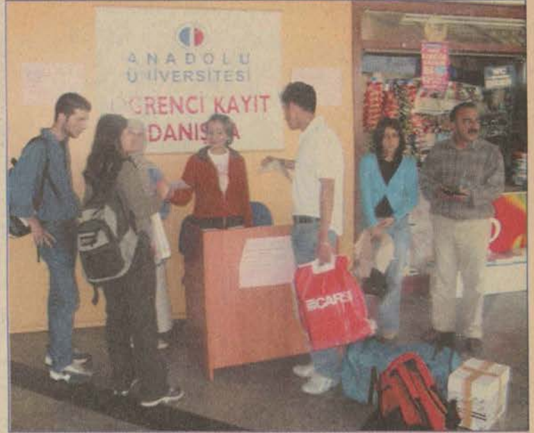
Kayıt için Eskişehir'e gelen öğrenciler, danışma masalarındaki görevliler tarafından bilgilendirilerek, üniversitenin araçlarıyla, kayıt yaptıracakları birimlere kadar ulaştırıldılar.