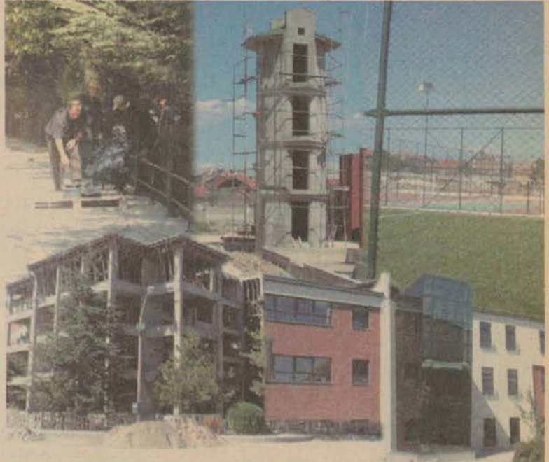
Kampuslerdeki çalışmaların yeni eğitim öğretim yılına yetiştirilmesi hedefleniyor

Kampuslerde son hızla devam eden yapılandırma çalışmalarının, yeni eğitim-öğretim yılına kadar tamamlanması hedefleniyor.