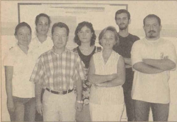
Biyoteknoloji Grubu kongreye 9 poster ve 1 sözlü bildiri ile katıldı.