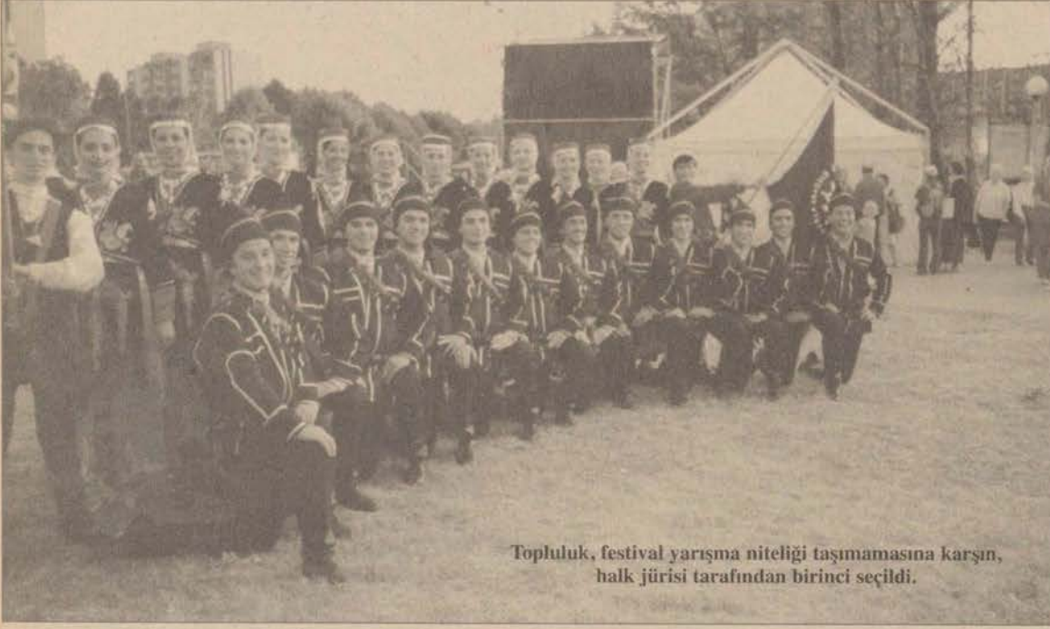
Topluluk, festival yarışma niteliği taşımamasına karşın, halk jürisi tarafından birinci seçildi.

Üniversitemiz Halkdansları Topluluğu, uluslararası bir folklor festivali için gittiği Polonya'da yine göz kamaştırdı.