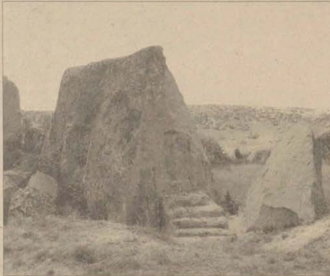
Döğer Küçük Kapı Anıtı da defineciler tarafından tahrip edilen Frig anıtları arasında yer alıyor.