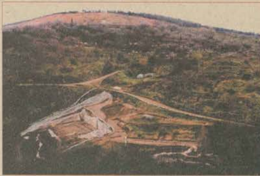
Osmanlı Dönemi Bilecik Kenti Çarşı Alanı Kazısı'nda yapılan koruma çalışmaları

Orhangazi İmaret Kazısı'nın tamamlanmasının ardından ise, farklı boyutlarda da, tarihi açılmış ve Cumhuriyet öncesi Bilecik Kenti'nin Çarşı Mahallesi hakkında genel bilgilere ulaşılmıştır.