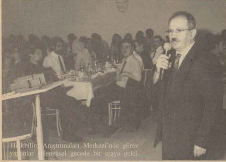
Halkbilim Araştırmaları Merkezi'nde görev yapanlar geleneksel gecede bir araya geldi.

Halkbilim Araştırmaları Merkezi "Geleneksel Halkbilim Gecesi"nde, eski çalışanlarla yenileri bir araya getirdi.