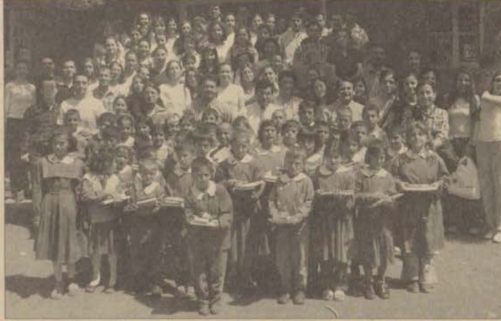
Öğretmen adayları birleştirilmiş sınıflı köy okullarını yakından tanıma fırsatı buldular.