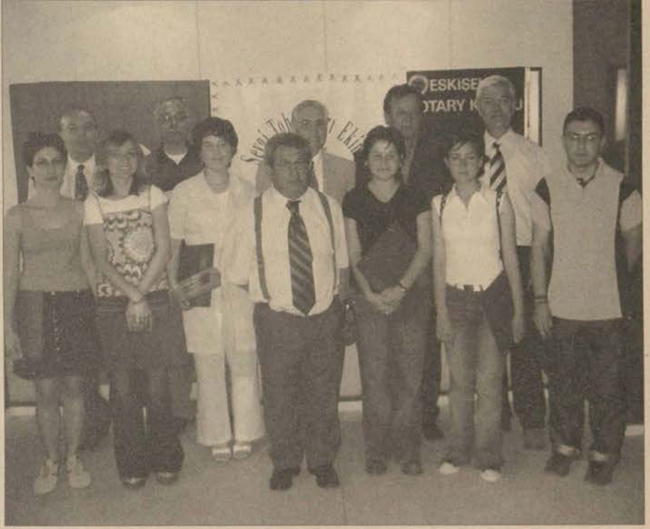
Daha önce resim dalında yapılan yarışmaya bu yıl baskı ve heykel dalları da eklendi.