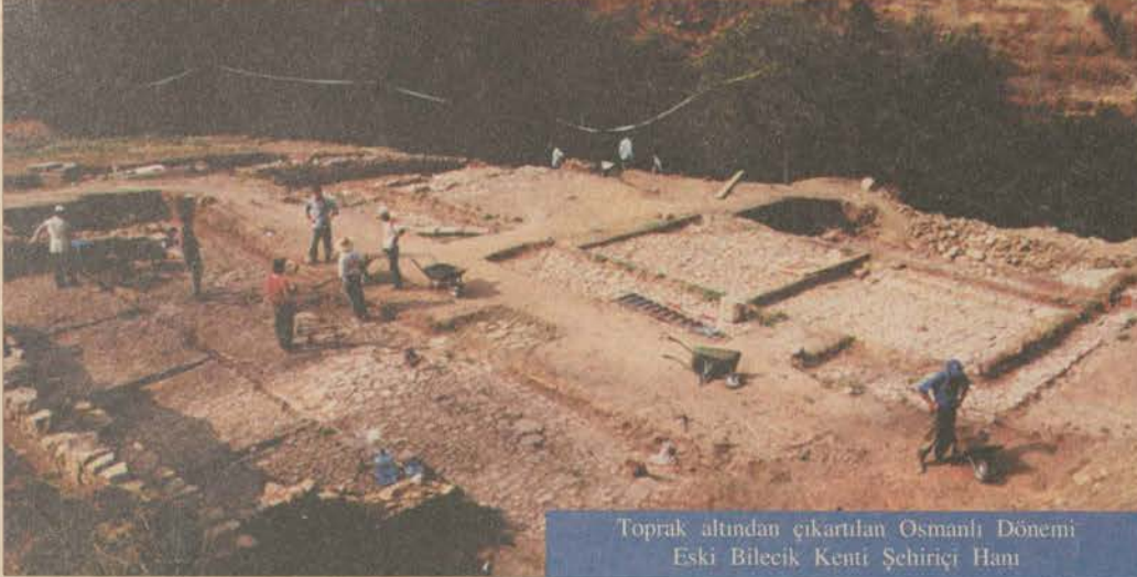
Toprak altından çıkartılan Osmanlı Dönemi Eski Bilecik Kenti Şehiriçi Hanı

Edebiyat Fakültesi'nin Eski Bilecik kentinde yaptığı kazılar Osmanlı tarihini gözler önüne seriyor.