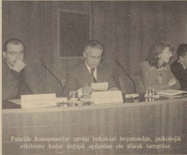
Panelde konuşmacılar savaşı hukuksal boyuttan, psikolojik etkilerine kadar değişik açılardan ele alarak tartıştılar.