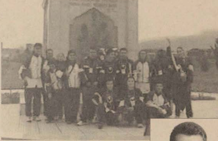
Taekwondocularımız şampiyonadan altı madalya ile döndü.