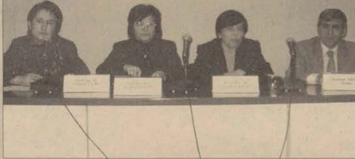
Panelde konuşmacılar, Almanca'nın ikinci yabancı dil olarak öğretilmesinin önemi üzerinde durdular.

Eğitim Fakültesi, "Almanca'nın İkinci Yabancı Dil Olarak Öğretilmesinin Önemi" konulu bir panel düzenledi.