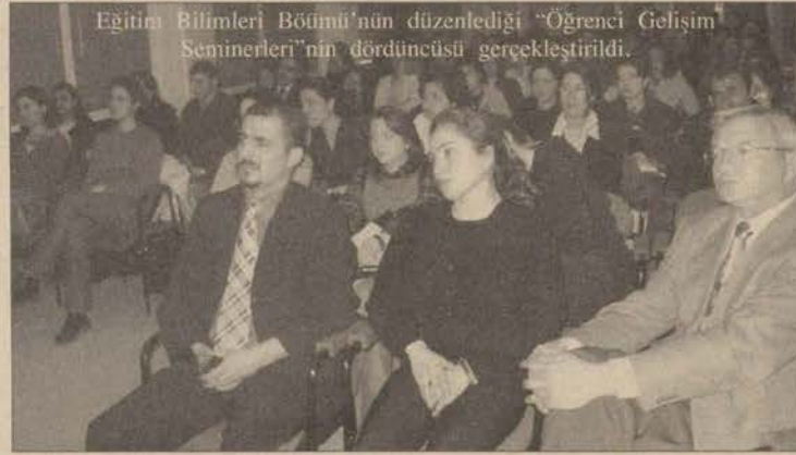
Eğitim Bilimleri Bölümü'nün düzenlediği "Öğrenci Gelişim Seminerleri"nin dördüncüsü gerçekleştirildi.