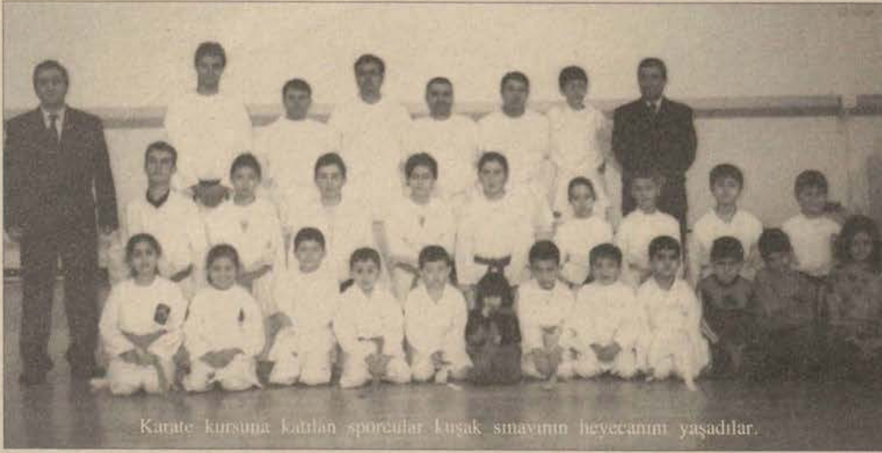
Karate kursuna katılan sporcular Kuşak sınavının heyecanını yaşadılar.

İstanbul'da düzenlenen Türkiye Üniversitelerarası Karate Birinciliği'nde üniversitemiz sporcuları bir gümüş bir de bronz madalya kazandı.