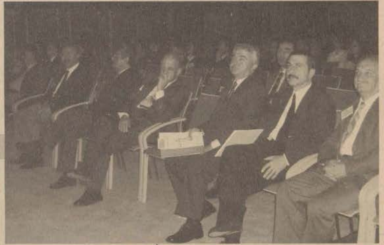
Hukuk Fakültesi tarafından düzenlenen sempozyumda, kamu personelinin sorunları tartışıldı.

dından başlayan sempozyumda toplam 14 bildiri sunuldu. Sempozyuma İstanbul, Maltepe, Selçuk, Diçle, Marmara, Erciyes, Atatürk ve Dokuz Eylül Üniversiteleri'nden katılm-