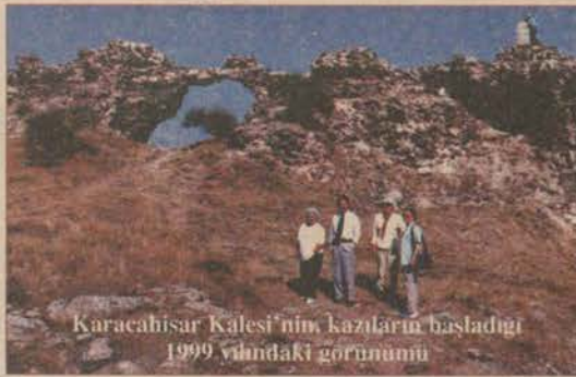
Karacahisar Kalesi'nin kazılarının başladığı 1999 yılındaki görünümü

Karacahisar Kalesi'nin toprak altında kalan kısmı gün yüzüne çıkarıldı.