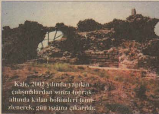
Kale, 2002 yılında yapılan çalışmalardan sonra toprak altında kalan bölümleri temizlenerek, gün ışığına çıkarıldı.

Karacahisar Kalesi'nin toprak altında kalan kısmı gün yüzüne çıkarıldı.