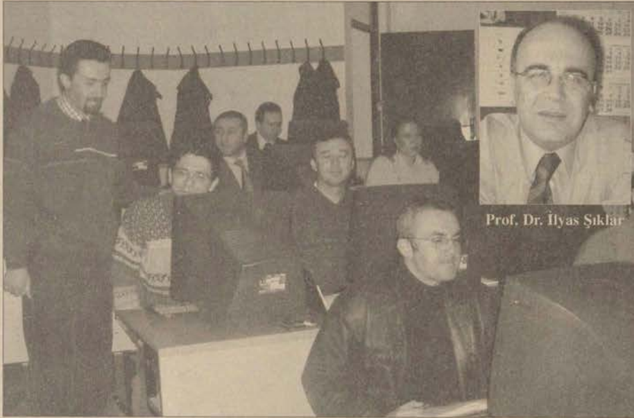
İktisat Bölümü öğretim elemanları SPSS kursu için bilgisayar başında.

Kurs hakkında bilgi veren İktisadi ve İdari Bilimler Fakültesi İktisat Bölüm Başkanı Prof. Dr. İlyas Şıklar, "İktisat dalında artık istatistik tekniklerinin kullanılması zorunlu hale geldi. Özellikle genç arkadaşlarımızın bu teknikleri tezlerinde kullanmaları gerekiyor. Bu sayede böyle bir kurs çalışmasına ihtiyaç duyduk" dedi. Bir altı yapı niteliği taşıyan Econlit veritabanından sonra ileriki bir tarihte de Eviews adlı bir ekonometri paket programının kursu başlayacak.