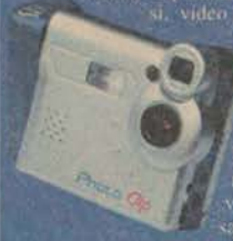
Photo Clip adlı cihaz dijital fotoğraf makinesi, video kamera, internet kamera, mp3 çaları, dijital ses kayıt cihazı ve taşınabilir sürücü olarak kullanılabilir. 16 veya 32MB standart bellek ile gelen Photo Clip, bellek yükseltme imkanı da sunuyor. Saatli ve tarihli gösteren bir ekrana sahip olan cihaz, çekilen fotoğrafa özel ses etiketi de ekleyebiliyor. Photo Clip, 5 ila 10 dakika AVI formatında video klip çekebiliyor.