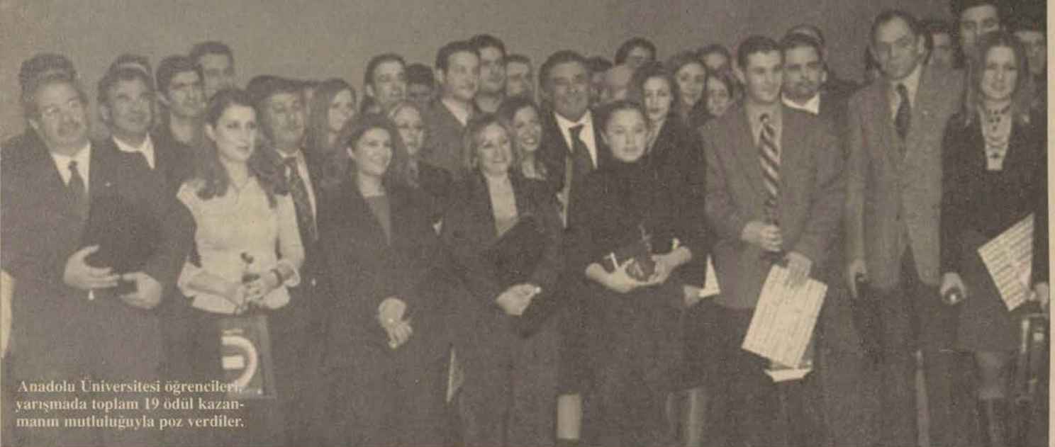
Anadolu Üniversitesi öğrencileri yarışmada toplam 19 ödül kazanmanın mutluluğuyla poz verdiler.

Aydın Doğan Vakfı'nın 14. Genç İletişimciler Yarışması'nda dereceye girenlere ödülleri Anadolu Üniversitesi'nde törenle verildi