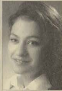
Zehra Derdiyok Eğitim Bilimleri Enstitüsü Yüksek Lisans

Bu yazı ile öncelikle İngilizce Öğretmenliği Lisans Programı'ndaki arkadaşlarıma seslenmek istiyorum. Başarması çok azim gerektiren ve emek isteyen bu programda okuma sorumluluğunu üstlendiğiniz için sizleri kutluyorum. Bu programın bizi diğer programlardan ayıran başlıca özellikler arasında, kendi başımıza çalışmamızı, araştırmayı ve kendimizi sürekli geliştirmeyi zorunlu kılmasıdır. Bu özelliklerimiz sayesinde geleceğimize (iş hayatı, öğretmenlik vs) birçok artı ile başlıyoruz.