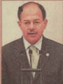
Sağlık Bakanı Recep Akdağ

Recep Akdağ yaptığı yazılı açıklamada, "Kalıtsal Kan Hastalıkları Kontrol Programı" hakkında bilgi verirken, Türkiye nüfusunun yüzde 2,1'inin Talasemi taşıyıcısı olduğunu, bu oranın bazı bölgelerde yüzde 13'lere kadar çıktığını belirtti. Talasemi tedavisinin uzun ve zorlu bir süreç olduğuna dikkati çeken Akdağ, "Bu hastalıkla mücadelede evlenecek çiftlerin evlilik öncesi yapacakları testlerin önemli bir rolü bulunuyor. Hastalık erken dönemde saptanırsa önlenmesi mümkündür. Doğacak çocuk için de bu risk azalacaktır" dedi. Akdağ açıklamasında, Türkiye'de Talasemi açısından risk düzeyi yüksek 33 ilde Kalıtsal Kan Hastalıkları Tanı Merkezleri'nin faaliyet gösterdiğini hatırlatarak, başlattıkları "Kalıtsal Kan Hastalıkları Kontrol Programı" çerçevesinde bu merkezleri 81 ile taşımayı hedeflediklerini bildirdi.