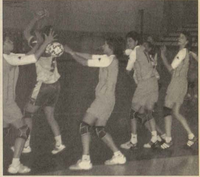
Bayan hentbolcularımız Osmangazi Üniversitesi'ne fark attı.