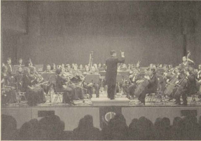
Anadolu Yıldızları, Köln konserinde sergilediği performansla büyük beğeni topladı.