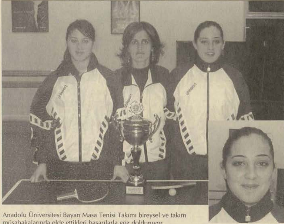
Anadolu Üniversitesi Bayan Masa Tenisi Takımı bireysel ve takım müsabakalarında elde ettikleri başarılarla göz dolduruyor.