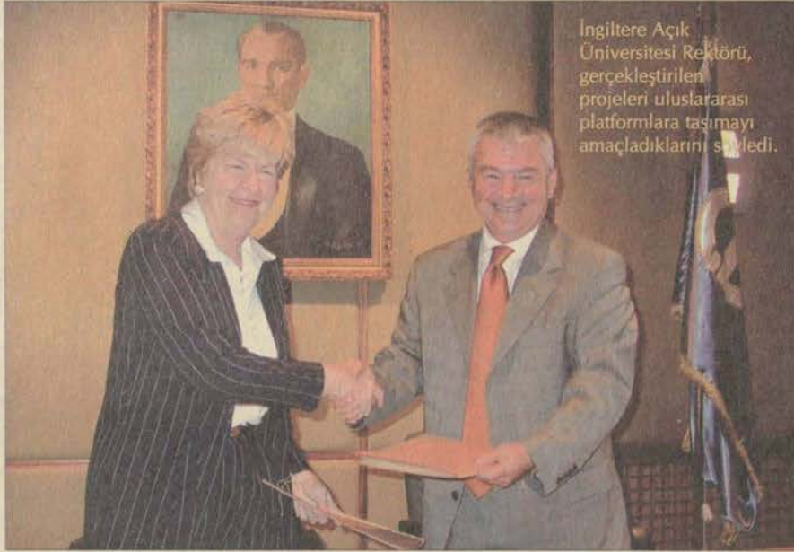
İngiltere Açık Üniversitesi Rektörü, gerçekleştirilen projeleri uluslararası platformlara taşımayı amaçladıklarını söyledi.