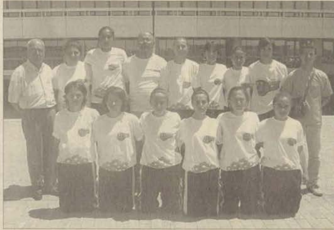
Yıldız bayan atletizm takımımız Türkiye finallerinde fırtına gibi esti.