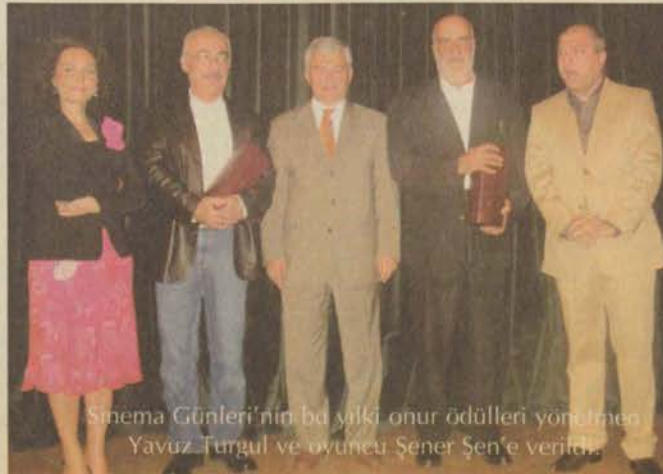
Sinema Günleri'nin bu yılki onur ödülleri yönetmen Yavuz Turgul ve oyuncu Şener Şen'e verildi.

İBF'nin düzenlediği sinema günleri 24 Mayıs'ta başladı.