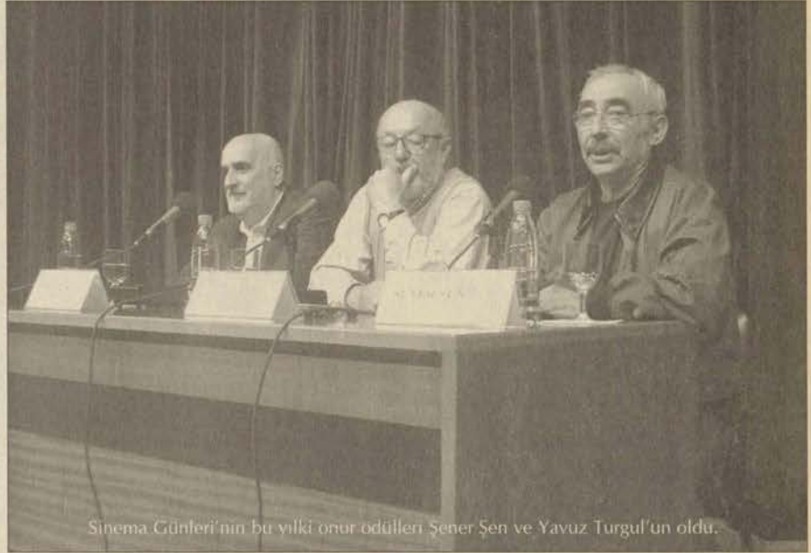
Sinema Günleri'nin bu yılki onur ödülleri Şener Şen ve Yavuz Turgul'un oldu.